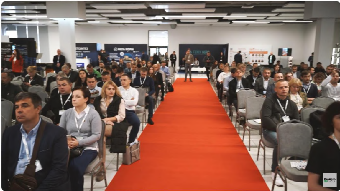
Український тваринницький саміт 2023: як це було?